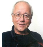
Antoine BAILLY , Géographe, Université de Genève