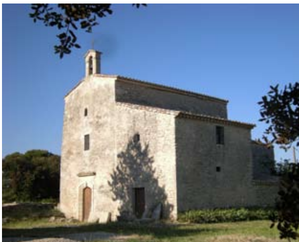
Chapelle St Nazaire

Située au sud-ouest du Gard, au bord du Vidourle, la commune d'Aubais est un lieu riche en histoire.